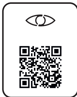
audiodeskrypcja audio description