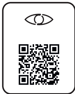
audiodeskrypcja audio description