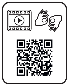
wideooprowadzanie video tour

Więcej informacji o bieżących wydarzeniach znajdziesz na stronie www.muzeum-lodz.pl Zachęcamy do odwiedzenia sklepu z pamiątkami i wydawnictwami.