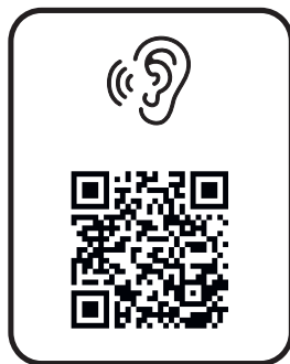
audioprzewodnik audio guide